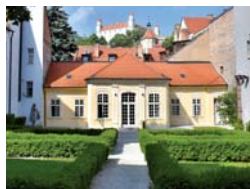
Lisztov pavilón a historická Lisztova zahrada