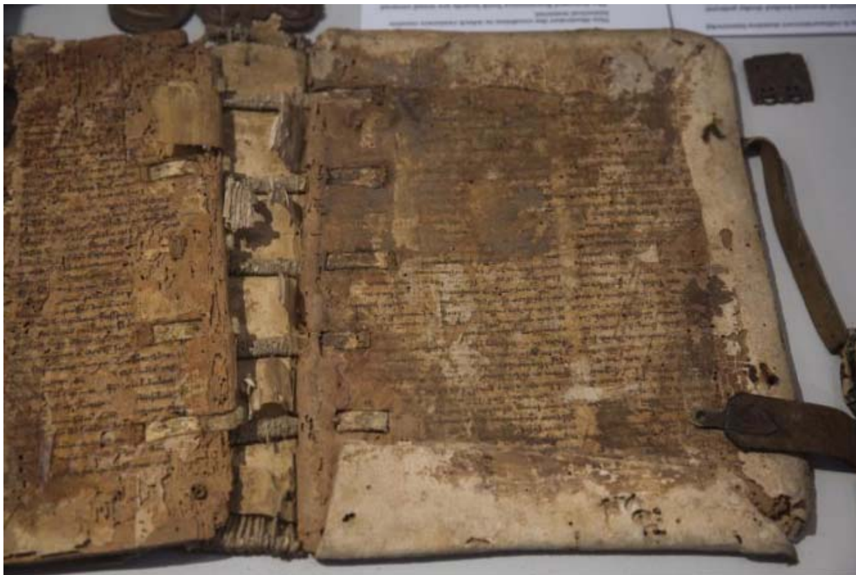
Poškodené: Reštaurátor sa často snaží zachrániť vzácne knihy, na ktoré zaútočila pleseň aj hmyz.