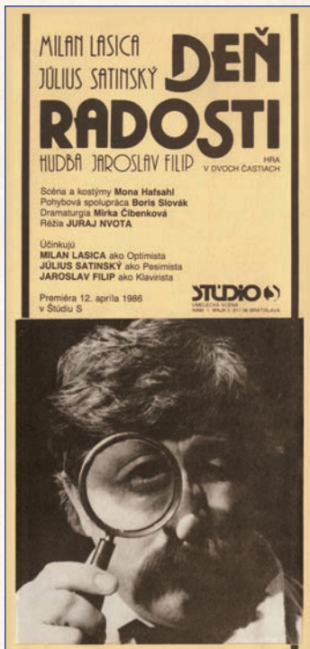
Bulletin k predstaveniu Deň radosti

Dielo Lasicu a Satinského boli a sú žánrovo odlišné, no spájali ich vždy nezameniteľný humor, dej založený na bežnom rozhovore obyčajných ľudí, spájanie slov a hra s ich významom. Ich predstavenia boli plné nečakaných zvrátov a reakcií a často sa text hry menil priamo na javisku vďaka brilantnej improvizovanosti oboch hercov. Komickosť dosahovali často tým, že ironicky posúdili banálne životné situácie do sféry absurdnosti. Ich hra bola charakteristická striedaním prvkov očakávania a následného sklamaní a teda právom boli a stále sú označovaní ako majstri paradoxných spojení. Ich odlišný prístup k divadlu a živý kontakt s divákom bolo to, čo ich najviac odlišovalo od vtedajšej divadelnej metodológie.