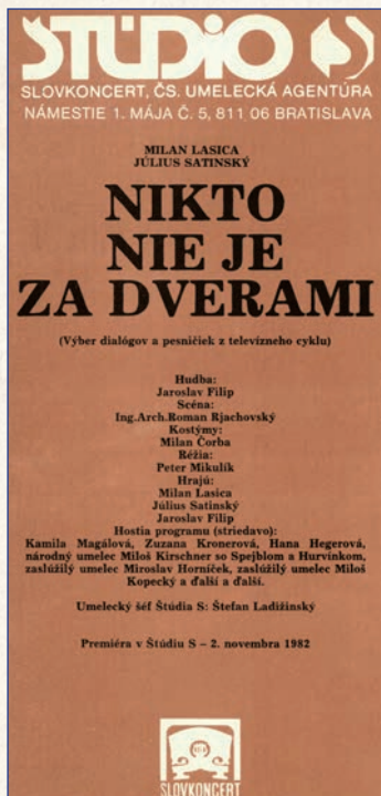
Bulletin k predstaveniu Nikto nie je za dverami

Od roku 1982, od vzniku Štúdia S, začali opäť naplno fungovať ako komediálna dvojica. Postupne začali uvádzať na pódium divadla svoje autorské predstavenia Nikto nie je za dverami (1982), Deň radosti (1986), Jubileum (1990) či Náš priateľ René (1991).