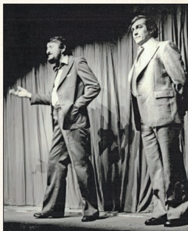
Milan Lasica a Július Satinský v komédii Strašne ošemetná situácia (1978)

Umeleckú tvorbu Novej scény počas jej existencie formovali jednak skúsení tradične, ale i moderne až experimentálne orientovaní režiséri a jednak herecký kolektív nabitý výraznými divadelnými i televíznymi osobnosťami ako František Dibarbora, Ladislav Chudík, Ivan Krivosudský, Ivan Mistrík a neskôr Július Satinský, Milan Lasica, Magda Paveleková, Zita Furková, Stanislav Dančiak, Marián Labuda, Milan Kňažko či Zuzana Kronerová.