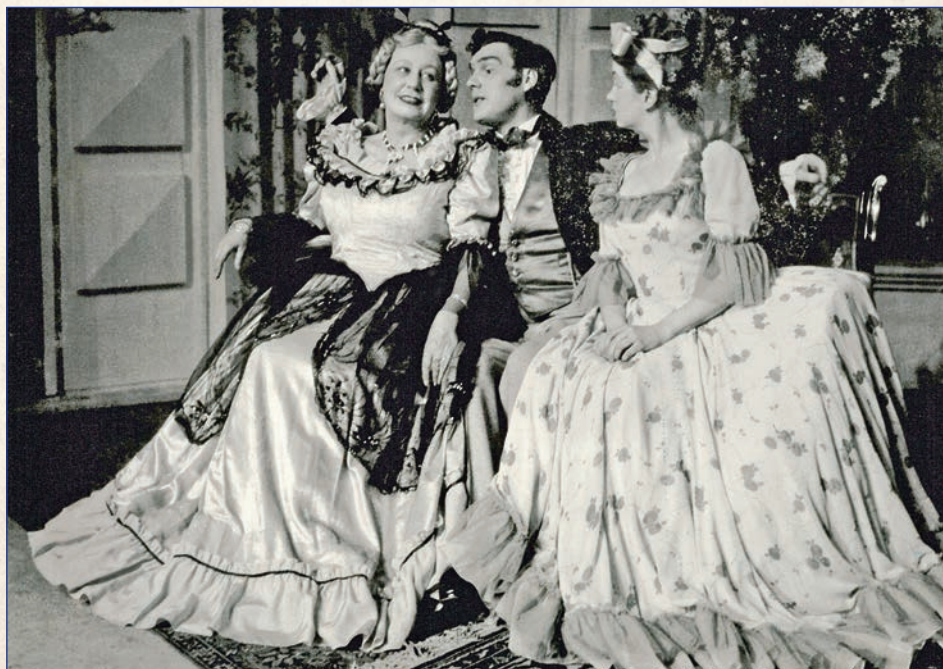
František Dibarbora ako Ivan A. Chlestakov v hre Revízor (1950)

Po zmene spoločensko-politických pomerov v novembri 1989 sa Nová scéna opätovne reorganizovala. V roku 1990 znova ožila idea Divadla na korze v novozriadenom Divadle Korzo '90, od roku 1993 Divadlo ASTORKA Korzo '90, do ktorého odišli najvýznamnejší predstavitelia činoherného súboru Novej scény. Na konci sezóny k 30. júnu 1990 zanikol Poetický súbor Novej scény a jeho členovia sa začlenili do činoherného súboru Komorná činohra a do novovzniknutej Komédie Novej scény. Na prelome rokov 1999 a 2000 pristúpilo vedenie Novej scény k zlúčeniu činohry a spevohry a vytvoreniu jedného Hudobno-dramatického súboru Novej scény.