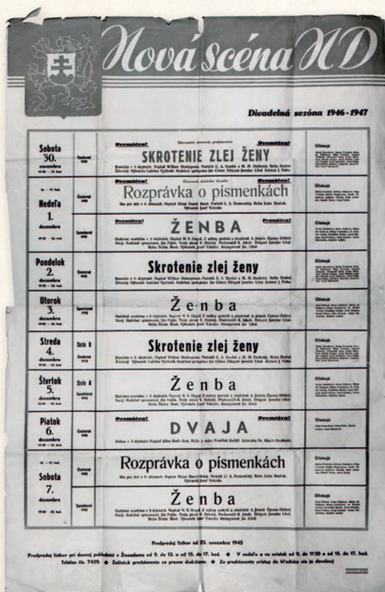
Prvý programový plagát Novej scény Národného divadla k divadelnej sezóne 1946/1947