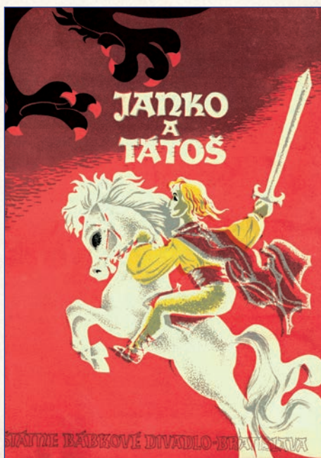
Titulná strana bulletinu k hre Janko a tátoš, premiéra: 1957