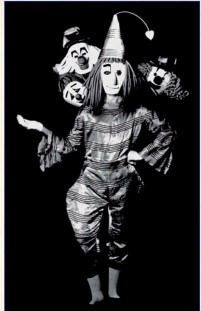
Fotografia z hry Concertino unisono , premiéra: 1973