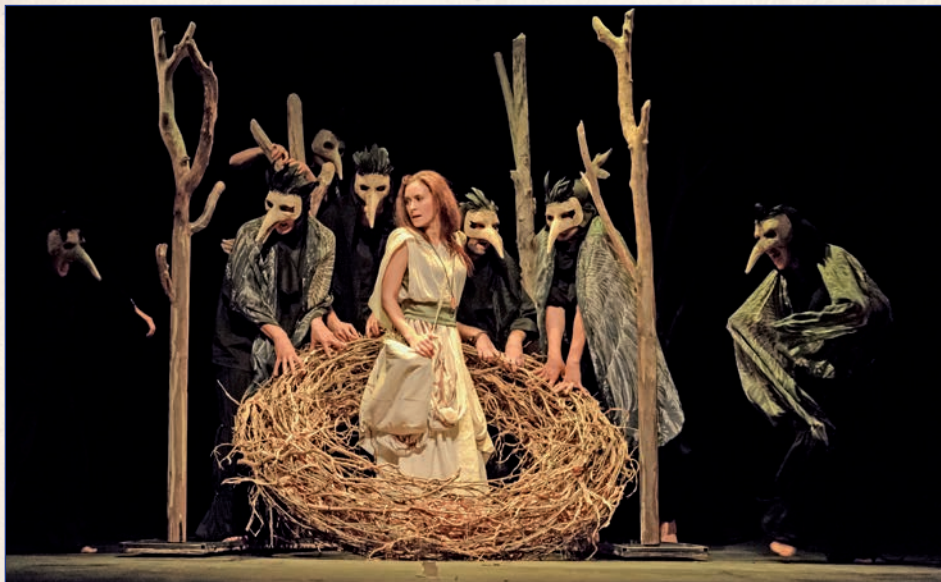
Fotografia z inscenácie Zhavranelí , premiéra: 2016