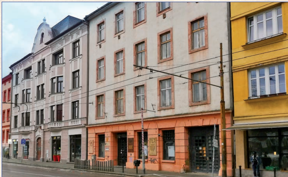
Sídlo Bratislavského bábkového divadla na Dunajskej ulici č. 36