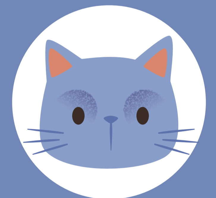
KONTAKTOM SO ZVIERATAMI