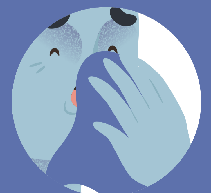
VŽDY ZAKRÝVAJTE SVOJ KAŠEĽ A KÝCHANIE VRECKOVKOU ALEBO RUKÁVOM, NEPOUŽÍVAJTE RUKY!