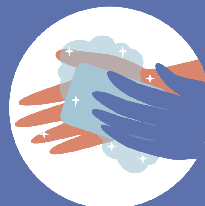
UMÝVAJTE SI ČASTO RUKY