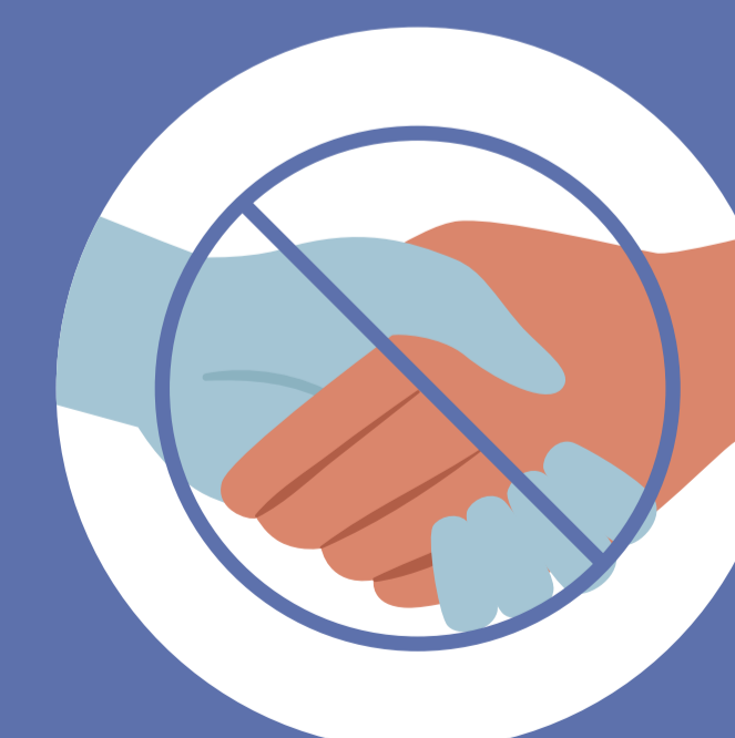
VYHÝBAJTE SA KONTAKTU S NAKAZENÝMI OSOBAMI