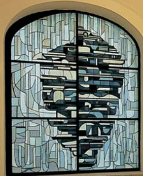
Palác Leopolda de Pauliho - vestibul s vitrážou