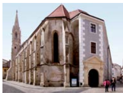
Kostol a kláštor klarisiek (vpravo) – prvá sídelná budova Univerzitetnej knižnice v Bratislave (pohľad z nárožia Klariskej a Farskej ulice)

ULIB collection consists of nearly 3 million library items. The library and information services are annually used by more than 19 000 active users with 650 000 loans. The University Library in Bratislava also fills a role of a multifunctional cultural centre, with nearly 400 scientific, cultural, educational, presentation and social events