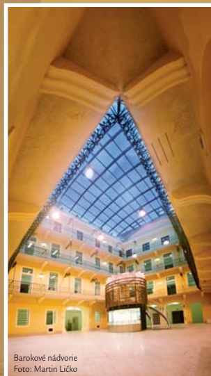
Barokové nádvorie