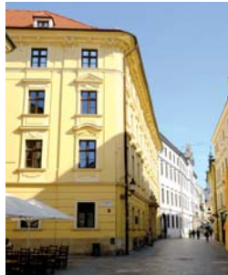
Palác Leopolda de Pauliho

taking place annually, with an annual attendance of more than 180,000 visitors. Most ULIB events are open to the public and are held in the lecture, seminar and exhibition halls, in the Liszt garden, and in the library's interior and exterior courtyards.