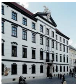
Palác Uhorskej kráľovskej komory