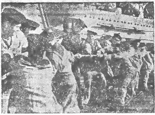
Veselý je život námorníkov ČA