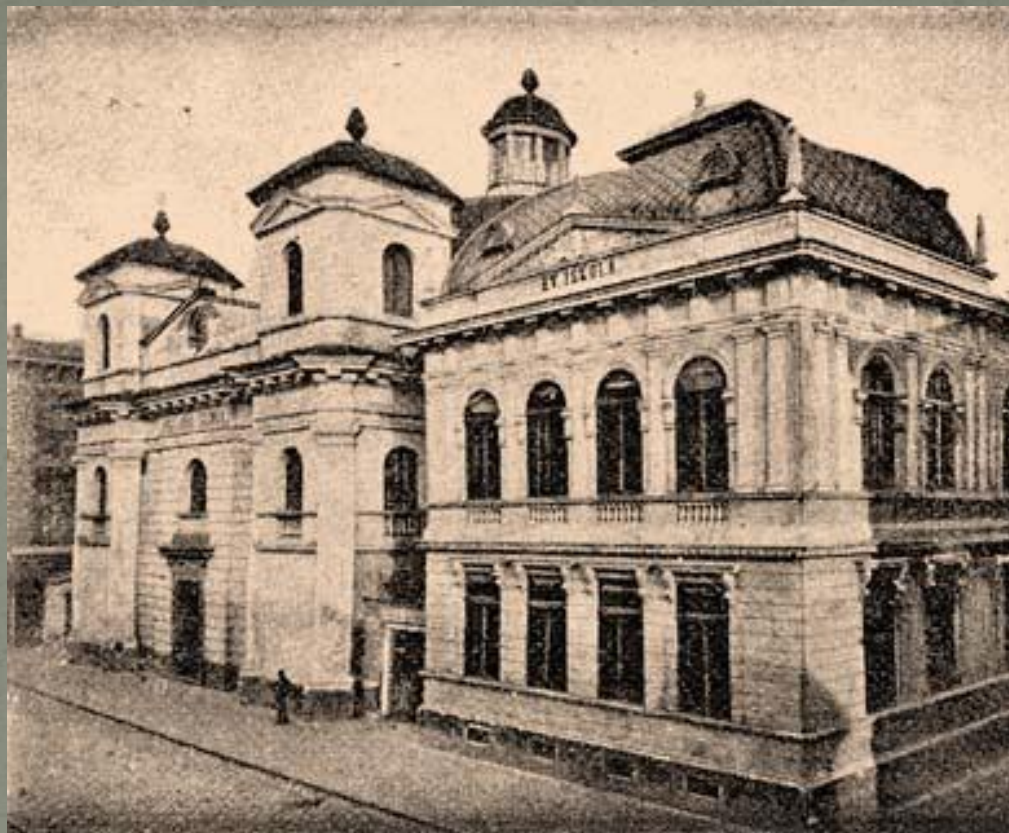
Dobová fotografia budovy evanjelického kostola a školy z: Borovszky, S: Magyarország vármegyéi és városai. Abauj-Torna vármegye és Kassa. Budapest : Apollo, 1896