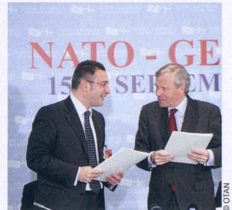
La réunion inaugurale de la Commission OTAN-Géorgie a lieu à Tbilissi le 15 septembre 2008 lors d'une visite en Géorgie du Conseil de l'Atlantique Nord, la plus haute instance décisionnelle de l'OTAN.

La crise géorgienne a eu un impact significatif sur les relations entre l'OTAN et la Russie – les réunions formelles du Conseil OTAN-Russie et la coopération pratique dans certains domaines ont été suspendues pendant plus d'un an.