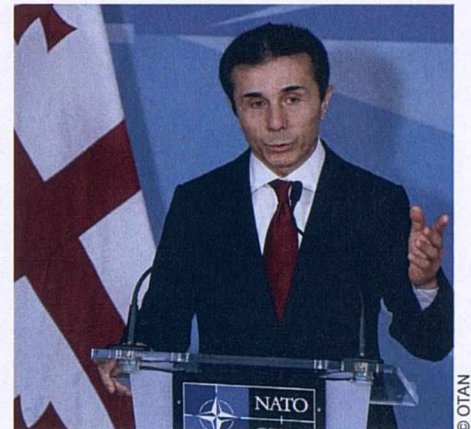
Le nouveau premier ministre géorgien, M. Bidzina Ivanichvili, s'adresse à la presse, à l'occasion d'une visite au siège de l'OTAN en novembre 2012, pour souligner l'engagement de son gouvernement à atteindre l'objectif fixé de l'adhésion de son pays à l'OTAN.

Pour faciliter les consultations et la coopération, la Géorgie a établi en 1998 une mission diplomatique permanente auprès du siège de l'OTAN, à Bruxelles. Elle est également représentée au Commandement allié Opérations (ACO), qui est implanté au Grand quartier général des puissances alliées en Europe (SHAPE), à Mons (Belgique).