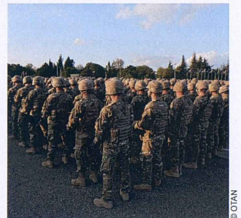
Un bataillon de maintien de la paix géorgien lors d'un défilé en septembre 2012, peu avant son départ pour l'Afghanistan.