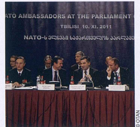
Le secrétaire général et les ambassadeurs des pays de l'OTAN rencontrent le président du parlement et des parlementaires géorgiens à l'occasion de la visite effectuée par le Conseil de l'Atlantique Nord en Géorgie en novembre 2011.

Un objectif majeur en termes de diplomatie publique, tant pour le gouvernement géorgien que pour l'OTAN, consiste à informer la population, à la sensibiliser et à gérer ses attentes quant à l'adhésion à l'Organisation, notamment en ce qui concerne les droits et les obligations qui y sont liés. La Géorgie est sur la bonne voie et a réalisé d'importants progrès dans un vaste programme de réformes. Elle doit poursuivre dans cette voie, en adoptant et en mettant en œuvre les réformes complémentaires requises, pour concrétiser ses aspirations à l'adhésion.