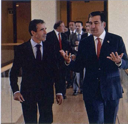
Le secrétaire général de l'OTAN, M. Anders Fogh Rasmussen (à gauche), s'entretient avec le président géorgien, M. Mikheil Saakachvili, alors qu'ils se rendent à une réunion au palais présidentiel de Tbilissi le 6 septembre 2012. Au cours de cette visite, le secrétaire général déclare que les réformes entreprises par la Géorgie la rapprochent encore de l'OTAN.

L'OTAN continue de soutenir l'intégrité territoriale et la souveraineté de la Géorgie à l'intérieur de ses frontières internationalement reconnues, et d'appeler la Russie à revenir sur sa décision de reconnaître l'indépendance des deux régions séparatistes. Le secrétaire général a diffusé des déclarations indiquant que l'OTAN ne reconnaît pas les élections organisées depuis lors en Ossétie du Sud et en Abkhazie et que leur tenue ne contribue pas à un règlement pacifique et durable.