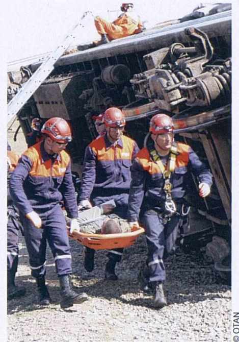
Simulation d'accident de train, d'après le scénario d'un exercice de grande envergure sur le terrain organisé en Géorgie en septembre 2012 sur le thème de la gestion des conséquences qui rassemblait des participants de pays alliés et partenaires.

Le programme SPS cherche aussi à renforcer les communautés scientifiques et universitaires dans les pays du Caucase du Sud. La Géorgie a participé au projet « Route de la soie virtuelle », qui a contribué à améliorer l'accès à l'internet des établissements de recherche du Caucase, de