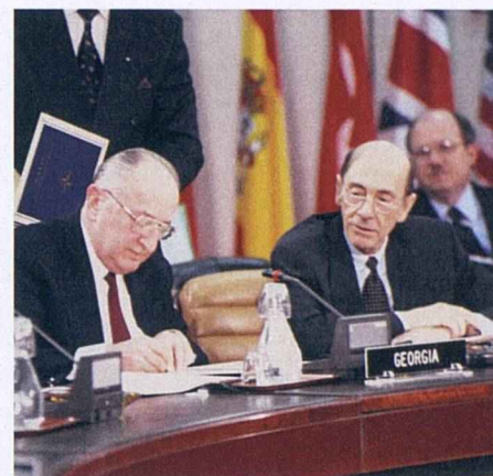
Le ministre géorgien des Affaires étrangères de l'époque, M. Alexandre Tchikvaïdzé, signe le document-cadre du Partenariat pour la paix le 23 mars 1994. La signature de ce document, qui définit les principales valeurs et les principaux engagements du partenariat, a ouvert la voie à l'instauration d'une coopération pratique bilatérale entre l'OTAN et la Géorgie.

Ces engagements et l'ensemble du programme du PPP et du CPEA ont pour but de susciter la confiance et de favoriser la transparence, de réduire les menaces qui pèsent sur la paix et d'établir des relations de sécurité plus solides avec les Alliés et les autres partenaires euro-atlantiques.