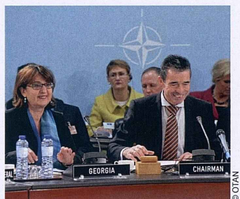
La ministre géorgienne des Affaires étrangères, Mme Maïa Panjikidzé (à gauche), à côté du secrétaire général de l'OTAN, M. Anders Fogh Rasmussen, lors d'une réunion de la Commission OTAN-Géorgie tenue au siège de l'OTAN le 5 décembre 2012. Les Alliés ont encouragé tous les partis en Géorgie à maintenir la dynamique des récentes élections et à consolider les progrès réalisés sur le plan démocratique. Ils ont également remercié la Géorgie pour sa contribution significative à la mission de l'OTAN en Afghanistan.

Alliance fondée sur les valeurs démocratiques, l'OTAN attend beaucoup des pays candidats, et elle invite instamment la Géorgie à poursuivre son vaste programme de réformes en vue d'atteindre son objectif d'intégration euro-atlantique. Les Alliés encouragent fortement la poursuite de la mise en œuvre par le gouvernement géorgien de toutes les réformes nécessaires, en particulier les réformes démocratiques, électorales, des médias et de la justice, ainsi que celles des secteurs de la défense et de la sécurité. Les efforts de