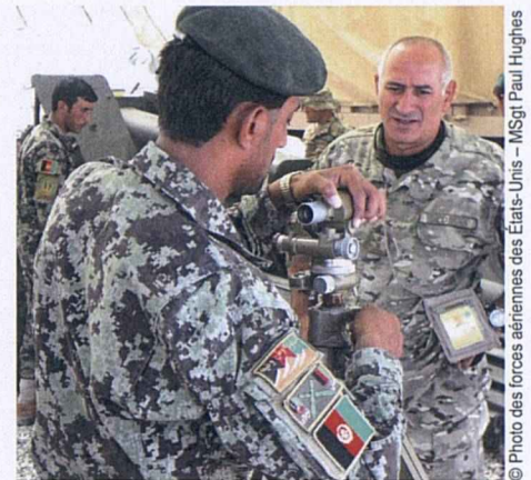
Un soldat géorgien observe un soldat de l'armée nationale afghane qui assemble une pièce d'artillerie au camp Hero à Kandahar (Afghanistan) en juillet 2011.

La coopération en matière de sécurité ne se limite pas à la mise à disposition de troupes pour les opérations. Dans le domaine de la lutte contre le