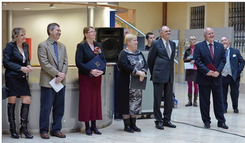
Minister školstva, vedy, výskumu a športu SR Dušan Čaplovič na otvorení TSK

V materiáli, v ktorom Slovenská asociácia knižníc a Spolok slovenských knihovníkov vyhlásili Týždeň slovenských knižníc, sa konštatuje, že „v súčasnosti knižnice na Slovensku nadväzujú na svoje historicky overené miesto v spoločnosti. Sú modernými inštitúciami, ktoré v dostatočnej šírke dokážu poukázať na svoj aktívny podiel na spoločenskom rozvoji obce, mesta, regiónu i kraja. Sú to práve kniž-