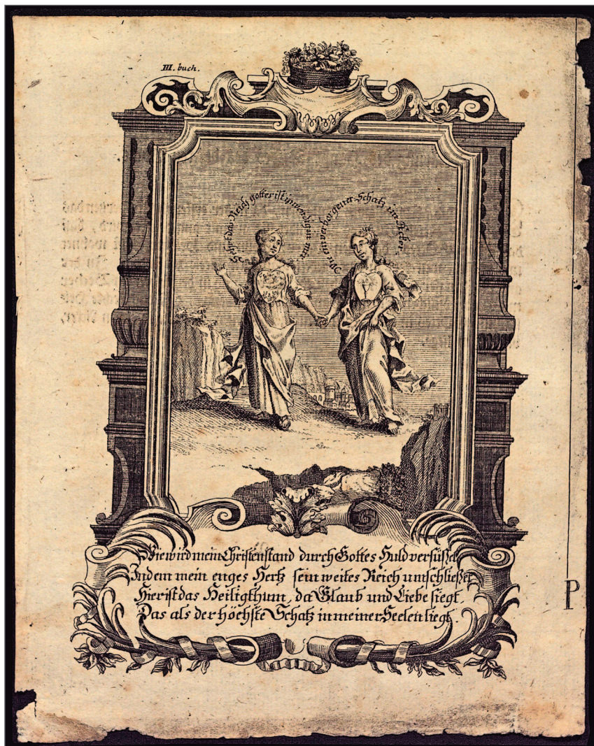
„Sämtliche Bücher vom Wahren Christenthum“ od Johanna Arndta (1743) zo zbierky emblémových kníh Univerzitnej knižnice v Bratislave